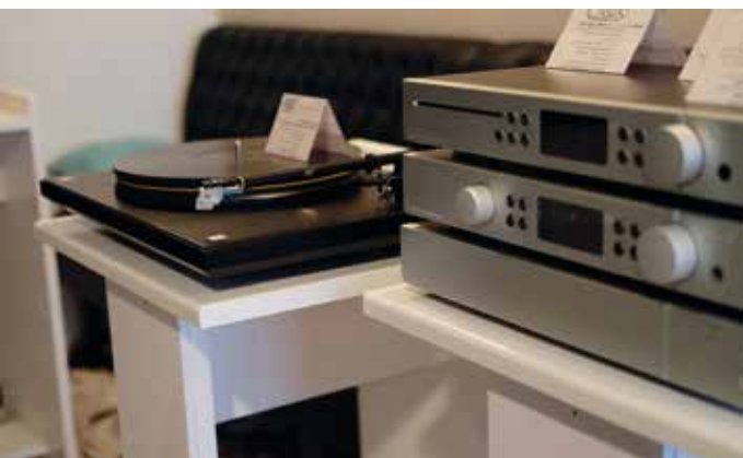
Mofi bij HNNY

Het feest der analoge bejubeling ging gewoon verder bij de statische stand van Acson. Een hele rits draaitafels stond opgesteld in alle soorten, maten en prijsstellingen. Product-specialist Erwin raakte er bijna niet over uitgepraat. Maar ja, het merk Pro-Ject valt ook steeds maar weer in de prijzen. Hun laatste was zowaar een EISA award, hetgeen geen kleinigheid is.