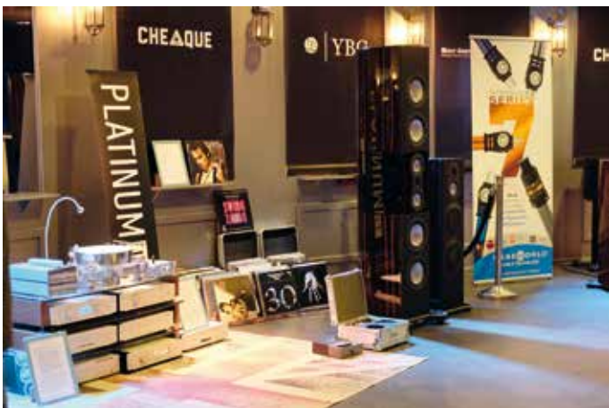
De Platinum 500 in volle glorie

In sommige ruimtes kon ik echt niet naar binnen. Die van Audiac was er zo tontje. Ik kon nog net een kiekje nemen van een rijtje McIntosh versterkers, maar daarna was het ook gelijk klaar. Ik heb dan ook alleen van horen en zeggen dat de merken Arcam, Sonus faber en Wadia goed aansloegen bij het publiek.