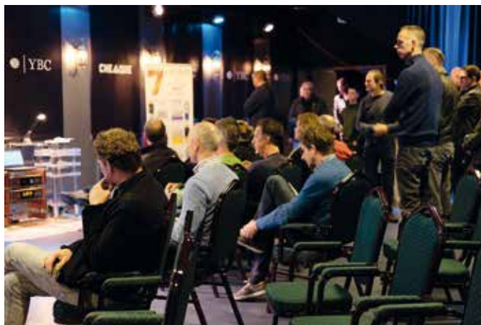
Drukke bij Monitor Audio

De volgende ruimte was die van de B&W Group waar gedemonstreerd werd met Bowers & Wilkins (ja, duh), Classé en Rotel. Ook hier gold dat je over de hoofden heen