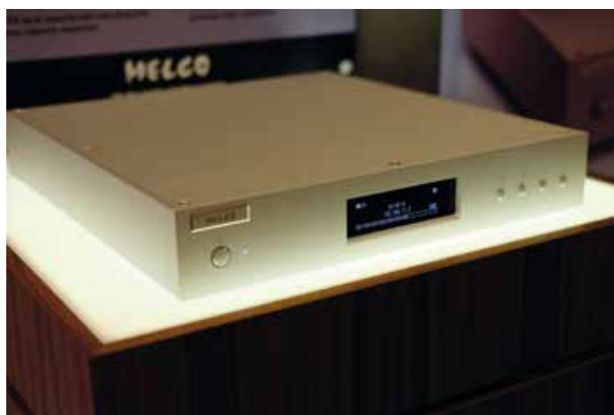
Melco bij Dimex