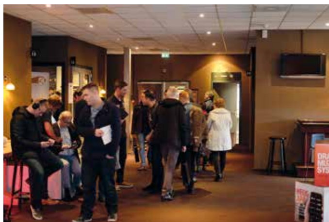
Tijd om te gaan