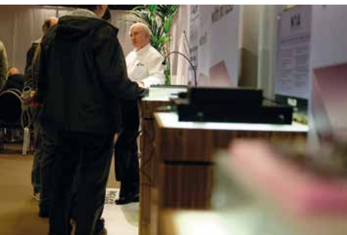
Melco's expert bij Dimex