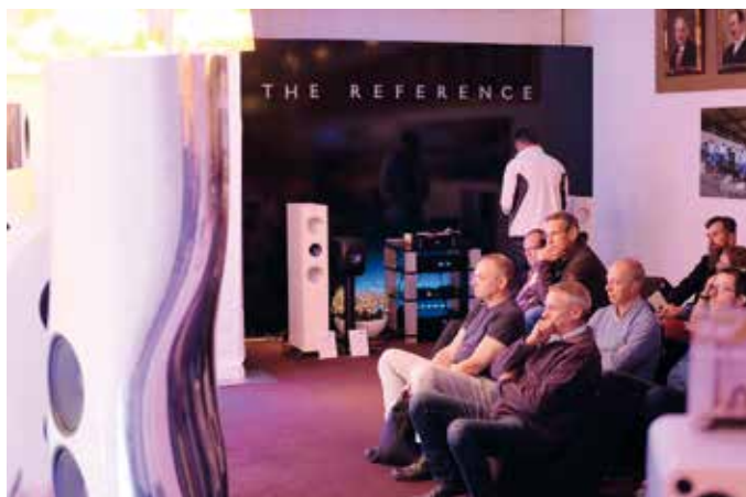
KEF Reference, LS50 Wireless en Muon gebroederlijk in een ruimte

Dat was trouwens ook het geval in de ruimte van Monitor Audio Nederland, waar niet alleen de nieuwe elektronica van