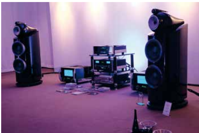
B&W en McIntosh arm in arm