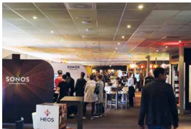
Drukte bij de catering boven