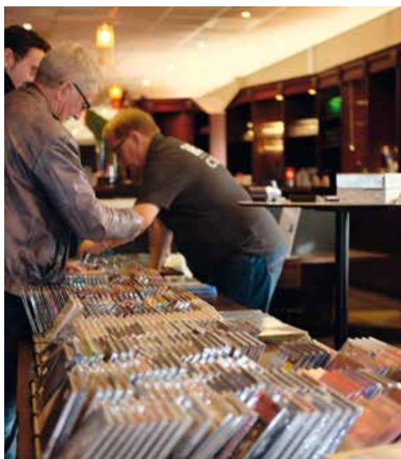
CD Vinyl 4U