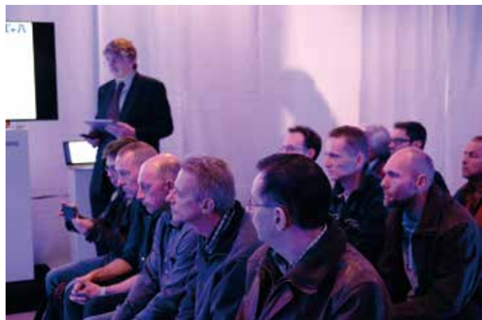
T+A uitgelegd door de expert