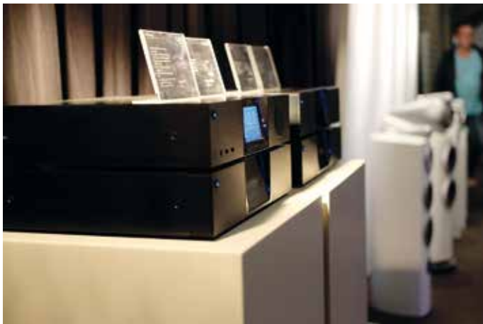
Classé bij de B&W Group