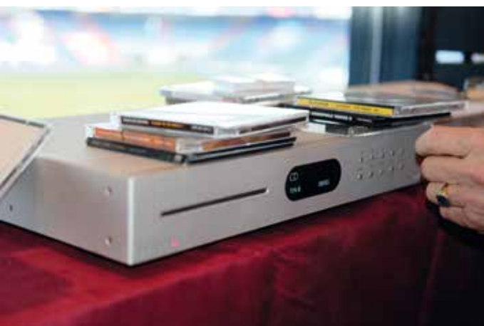
Castle bij Quad-raad