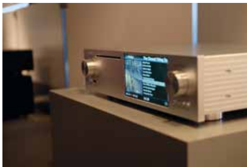
Cocktail Audio bij Armour Home