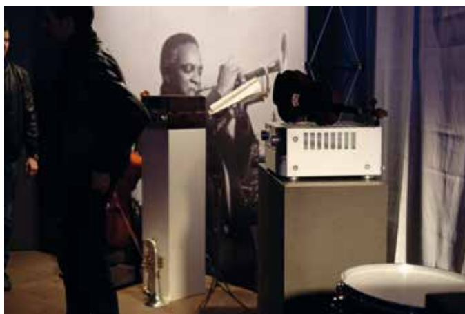
D+M met Denon en Marantz

kon lopen, maar toch zag ik kans een zijaanzicht te maken van een set Classé, geflankeerd door een aantal B&W's. Heb in deze ruimte helaas niets kunnen beluisteren, maar mijn vorige ervaringen met B&W waren dusdanig dat ik eigenlijk van tevoren al kon zeggen dat het "lekker" zou klinken. Na een later bezoek kon ik nog wel enige tevreden luisteraars vereeuwigen. Opvallend was ook de onderlinge sportiviteit