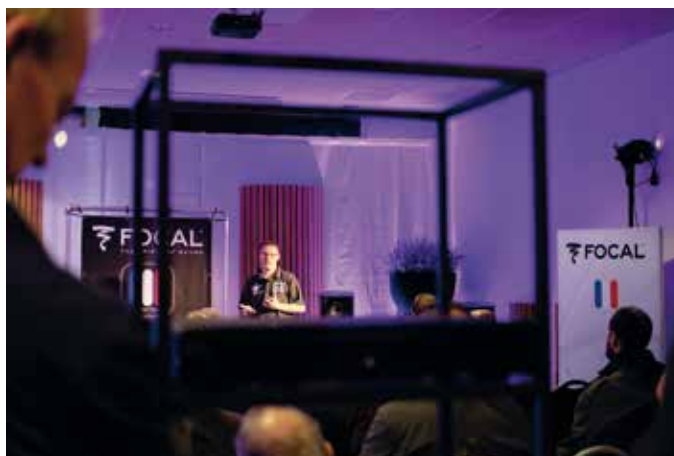
Focal bij Smart Audio