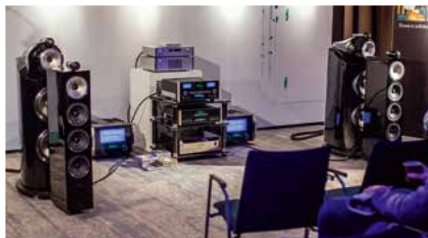
BOWERS & WILKINS